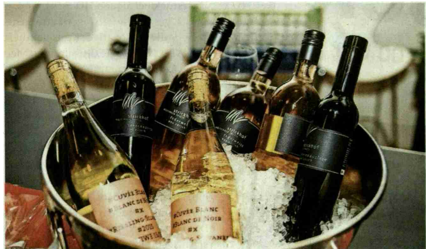
In der hinteren Reihe die Strickhof-Weine «Strickhof Beerenauslese Solaris 2015» (ganz links) und «Strickhof Federweiss 2016».