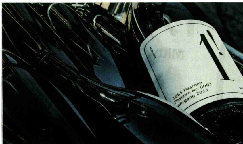
Der vielfach preisgekrönte «Strickhof Pinot Noir 1! 2011».

Referenz: 67137036 Ausschnitt Seite: 2/2