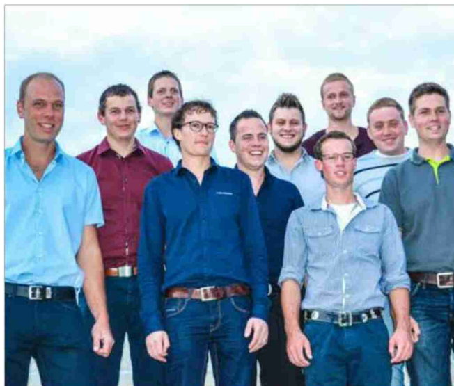
Absolventen mit dem Titel Meisterlandwirt/in.

Er wünschte sich wieder mehr Gleichgewicht zwischen Ökologie und Ökonomie. Gut gemeinte Verfassungsartikel reichten den Bauernfamilien nicht für ein angemessenes Einkommen: «Es braucht ent-