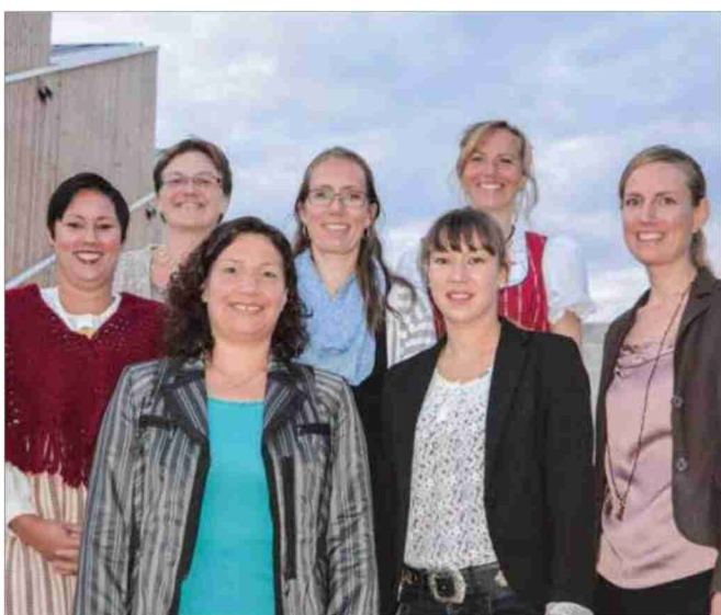
Bäuerinnen mit eidgenössischem Fachausweis.

plome verliehen an angehende Betriebsleiter Landwirtschaft (darunter eine Betriebsleiterin) mit eidg. FA, Meisterlandwirte; an Bäuerinnen mit eidg. FA/Dipl. Bäuerinnen sowie an