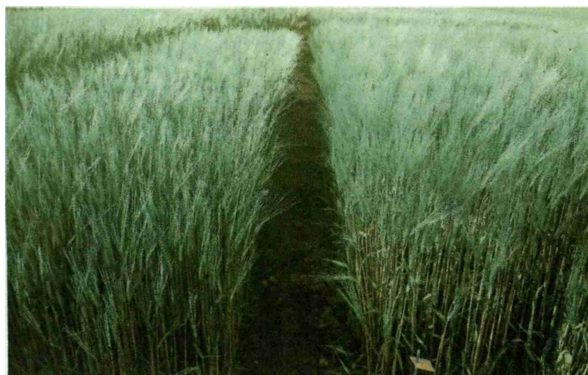
Vielversprechende Gerstenparzellen in Humlikon 2014.