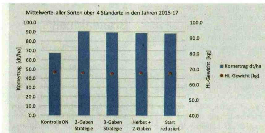
Ertrag und Qualität von Wintergerste je nach Düngeverfahren.