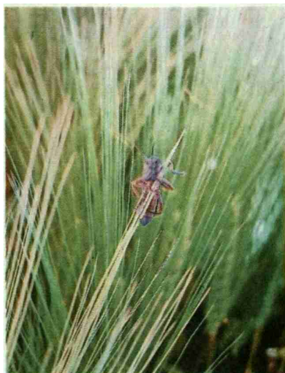
Mit Gerste hoch hinaus – Soldatenkäfer an Gerstengranne.