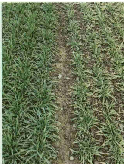
Deutliche Verfahrensunterschiede im Düngungsversuch im Frühjahr 2015 am Standort Lindau.