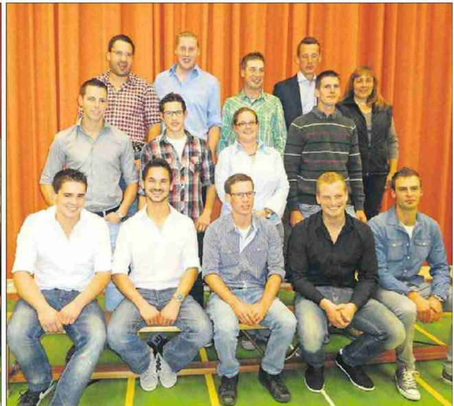
Durften die Gratulationen für ihren Abschluss entgegennehmen: die Bäuerinnen mit eidg. Fachausweis (oben links); die Meisterlandwirtinnen und Meisterlandwirte (oben rechts); die Agrotechniker(-innen) HF (unten links) sowie die Betriebsleiterinnen und Betriebsleiter.