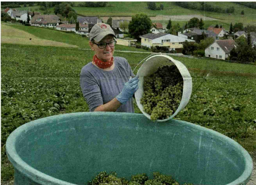
So macht die Traubenernte Freude.

Themen-Nr.: 540.003 Abo-Nr.: 1088177 Seite: 1 Fläche: 51'003 mm 2