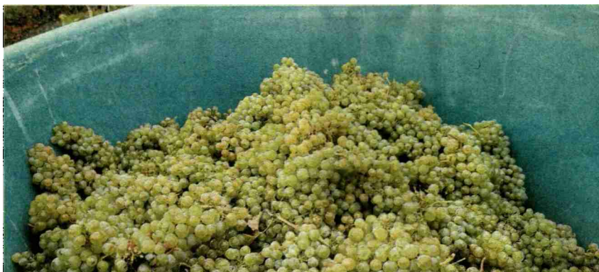
Gute 76 Oechslegrade wurden gemessen.