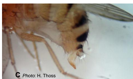
C Photo: H. Thoss