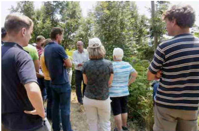
Die Merkmale der wichtigsten Neophten und ihre Bekämpfungs- und Entsorgungsmöglichkeiten wurden an verschiedenen Standorten besprochen.

Letzten Sommer führten die beiden Ämter AWEL und ALN in den verschiedenen Bezirken des Kantons erstmals Schulungen zum Thema Neobiota durch, um die Gemeinden zu sensibilisieren, zu informieren sowie untereinander zu vernetzen. 2015 werden die Schulungen wieder durchgeführt – noch konkreter und auf die Bedürfnisse der Gemeinden zugeschnitten.