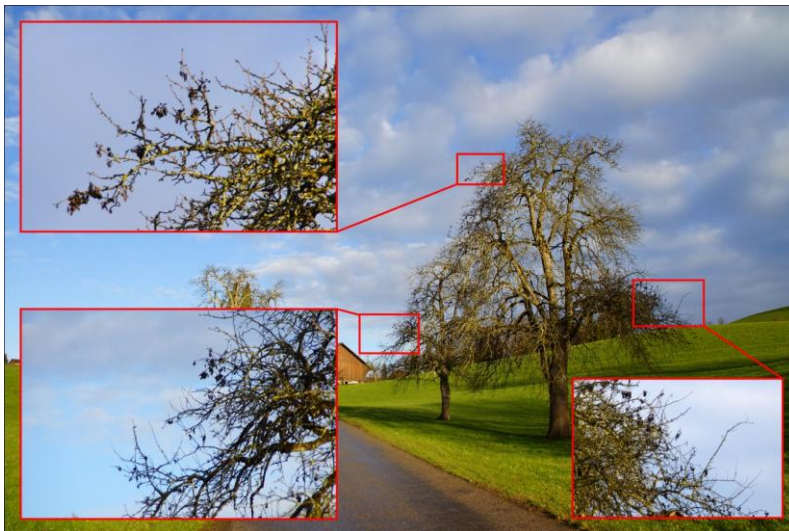
BLEIBEN SOLCH STARK BEFALLENE BIRNBÄUME STEHEN, DIENEN DIESE ALS QUELLE FÜR NEUE FEUERBRANDINFESTIONEN WÄHREND DER KOMMENDEN KERNOBSTBLÜTE.

Dieses Merkblatt zeigt typische Symptome an alten und jungen Birnbäumen und soll die Kontrolle im Winter erleichtern.