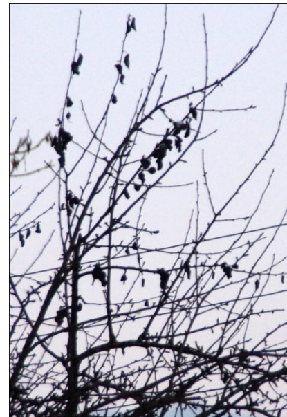
BLÄTTER UND KLEINE BIRNEN BLEIBEN AN BEFALLENE BAUMPARTIEN ZURÜCK.