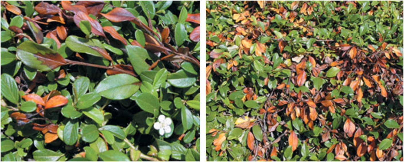
Abb. 4: Die Cotoneaster -Böschung ist massiv mit Feuerbrand befallen.

HP-100) gemessen worden sind (siehe Abb. 5). Wenn die Blütezeiten von Kernobst mit der von C. dammeri verglichen werden, sieht man, dass sich die beiden Perioden nicht überlappen; Birnen und Äpfel blühen zwischen Mitte April und Mitte Mai, die letzten endeten am 22. Mai. Die Obstbäume waren schon abgeblüht, als bei C. dammeri die Blütezeit gegen Ende Mai begann (siehe Abb. 5).