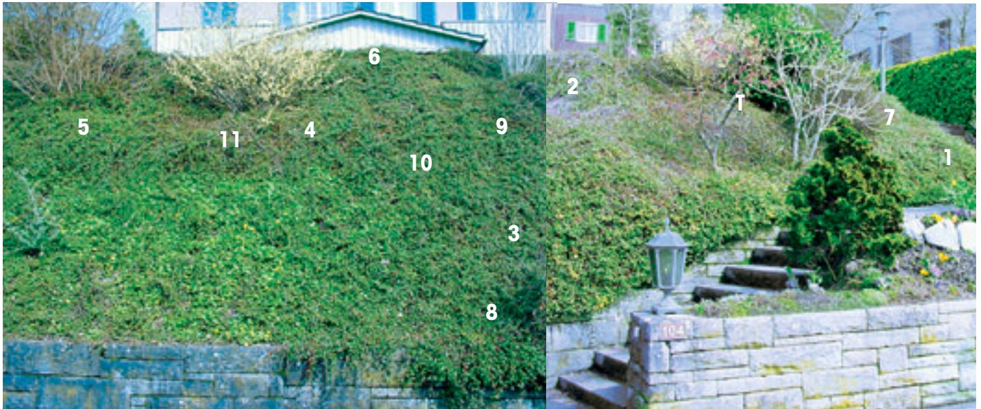
Abb. 1: Cotoneaster dammeri -Böschung in Herrliberg (Kt. ZH). Die untersuchten Stellen sind von 1 bis 11 nummeriert (T=Gerätekasten mit Temperaturfühler).