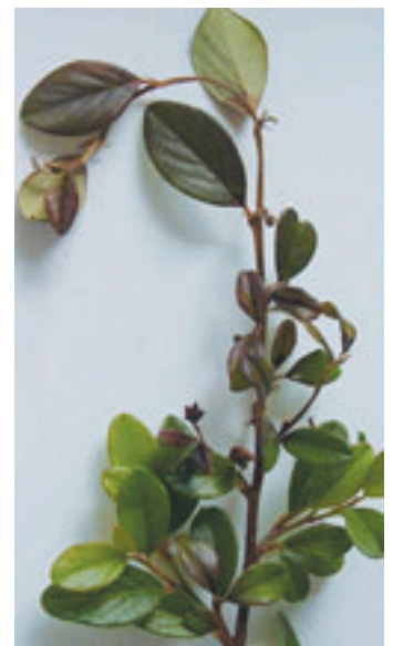
Abb. 3: Erste frisch infizierte Blüten und Triebe.

Die Temperaturen in der Böschung haben sich wenig und nur selten von den Messwerten unterschieden, die in der gleichen Periode in der Obstanlage in Herrliberg mit einer Wetterstation (Luft